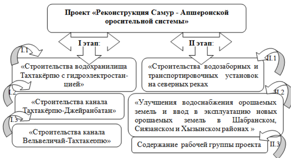
Рисунок 4. Проект «Реконструкция Самур-Апшеронской оросительной системы»