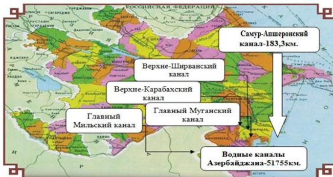
Рисунок 2. Размещение Самур-Апшеронского канала